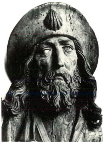
Afb. 5 Een fraai houten beeld van de Heilige Jacobus uit rond 1500. Het beeld maakte deel uit van het Twaalf Apostelen altaar in Windsheim in Duitsland. Het bevindt zich nu in het Kurpfälzisches Museum in Heidelberg. Een mooie St. Jacobsschelp siert de hoed.

In een vunzig, stampvol hangend winkeltje met de meest wonderlijke zaken, ontdekte ik hangend aan een van de duizend spijkers een drietal onnozele lapjes maar wel erop genaaid een overbekende Cypraea annulus . Binnen in het lapje opgevouwen een stukje tekst uit de Koran. Het geheel was onmiskenbaar een amulet, want er hingen meer amuletten in de buurt, gemaakt van stukjes blik, een tand van één of ander zoogdier, en andere waardeloze prullen. Die liet ik hangen, maar de amuletten met