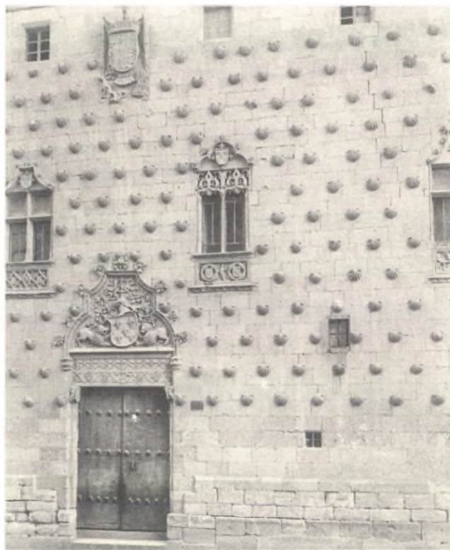
Afb. 4 Detail van de gevel van het Casa de los Conchas - het huis met de schelpen in Salamanca in Noord Spanje.

Bent u een week-end in Parijs en bezoekt u naast de "Follies" ook Versailles en dan natuurlijk het paleis van Koning Lodewijk XIV, let u dan eens op de vele gebeeldhouwde figuren die gerangschikt staan rond de grote vijvers achter het paleis. Kleine figuurtjes die op Triton's blazen, een ander die op een presenteerblad aan een beeldschone vrouw o.a. schelpen aanbiedt. De moeite waard om eens