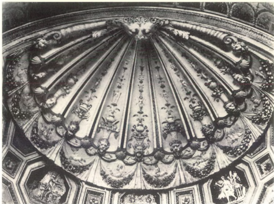
Afb. 2 Detail van het plafond van de Sixtijnse Kapel in Rome. Tussen de overdaad van guirlandes, druiventrossen en bloemfiguren zijn ook een groot aantal Pectenschelpen te ontdekken.

sfeervol gedicht van Huygens of Vader Cats waarin wordt gezongen over "de fraayheit der schepse- len van de zee", maar waarom zou onze belangstelling ook niet voor zulke nevenzaken gewekt kun- nen worden .