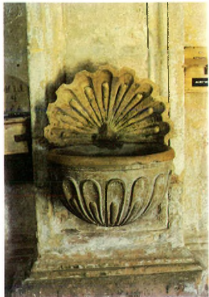
Afb. 3 Wijwatervat

Houdt uw koffiepauze op lange ritten eens in de buurt van een mooi oud kerkje. Loop er op het heetst van de dag even binnen en ontdek soms iets bijzonders, maar misschien ook wel een mooi oud wijwatervat, dat onmiskenbaar ontleend is aan de vorm van de Pecten (Afbeelding 3). Maar zulke voorbeelden van ornamentering gebaseerd op de Pecten vorm zijn er legio. Richt Uw blik maar eens naar het plafond in de Sixtijnse Kapel in Rome en u zult versteld staan (afbeelding 2).