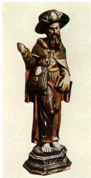
Afb. 6 Beeld van de H. Jacobus Major, destijds opgesteld in de Jacobus Kapel te Diest.

Het beeld werd vervaardigd in 1601. Op de hoed en de zijtas zijn Pectenschelpen bevestigd.