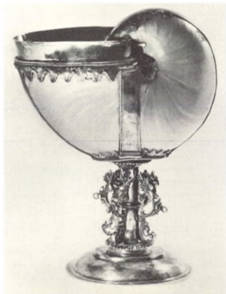
Afb. 1 Zilveren Nautilus beker vervaardigd door Ocke Janssen in 1653. De schelp is eerst tot op de parelmoerlaag van de buitenste kleurrijke laag ontdaan. Dit kostbare stuk is te zien in het Fries Museum te Leeuwarden, maar ook elders komt men de Nautilusbekers nog wel eens tegen.

Wat ik bedoel zijn tekenen van geheel andere aard, vaak produkten van mensenhand, maar wel van mensen die toch een grotere of kleinere affiniteit bezaten met de wereld van de schelpen. Wie een brede belangstelling heeft voor alle aspecten van de weekdierkunde, komt vroeg of laat ook in aanraking met uitingen van kunst, religie, volkskunst, archeologie, poëzie, waarin schelpen een rol spelen. Er ligt weliswaar een hemelsbreed verschil tussen een anatomisch praktikum van de wulk en een